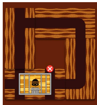
Un tunnel ne débouche pas sur du vide que l'on ne peut raccorder.